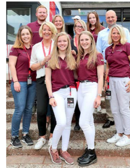
Engagiert für das Turnier: Das Team der Brunswiek Marketing GmbH

Mit Stand heute zählen wir 30.500 Zuschauer und Besucher. Der zwischenzeitliche Wettereinbruch hat uns in der ersten Turnierhälfte und am Freitagabend ein paar Besucher gekostet. Aber