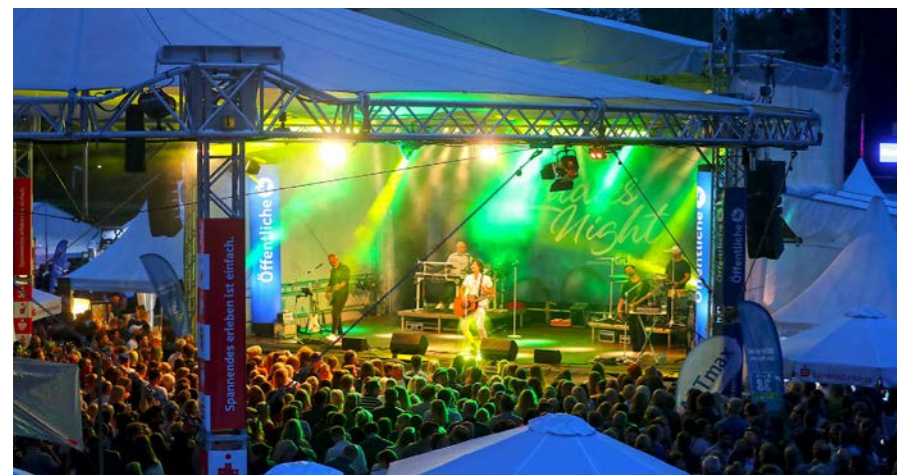
Die Ladies Night war wieder einer der erfolgreichsten Abende.

Fünffmal bereits ist das Turnier als bestes Challenger der Welt ausgezeichnet worden. Was ist Ihr persönlicher Antrieb? Niemals Stillstand eintreten zu lassen. Immer weiter zu optimieren ist das Ziel und immer wieder neue Wege zu gehen.